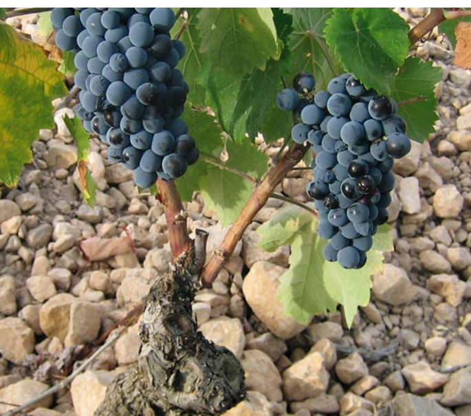
Ungepfropfter Monastrell-Rebstock in der Parzelle La Solana (l.), Garnacha-Rebzeilen in Las Gravas (r.).

Am nächsten Morgen überrascht uns Jumilla mit seinen saftig grünen Parks und den fröhlich dahinplätschernden Brunnen, schliesslich befinden wir uns hier bei nur 300 Millimeter Niederschlag pro Jahr in einem Dürregebiet! Casa Castillo liegt in einem in sich geschlossenen Hochtal rund 800 Meter über Meer, nur wenige Kilometer vom Stadtzentrum entfernt. Die weiss gestrichenen Gutsgebäude mit ihren in Blau gefassten Fenstern, Türen und Öfen erinnern schon stark ans nahe Andalusien. Was sofort auffällt, ist die generelle Kargheit der Landschaft. Finden wir in den tiefer gelegenen Rebparzellen noch reichlich Ton in den sehr sandbetonten Böden, so wurzeln die Stöcke gegen die Hügel hin zunehmend in sehr steinigem Terroir. Ein entscheidender Qualitätsfaktor sind auch die gewaltigen Temperaturunterschiede von rund 20 Grad Celsius zwischen Tag und Nacht in den Wochen vor der Ernte. Zudem werden die Reben nicht künstlich bewässert, sie müssen selbststän-